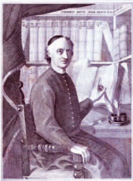
EGIDIUS FORCELLINUS OBITU TRID. NON. APRIL. AN. MDCCXCVI. VI. AN. LXXIX. III. IUL. AN.

Lexikographie als Lebensaufgabe: Egidio Forcellini, der Verfasser des bedeutenden „Lexicon totius latinitatis“.